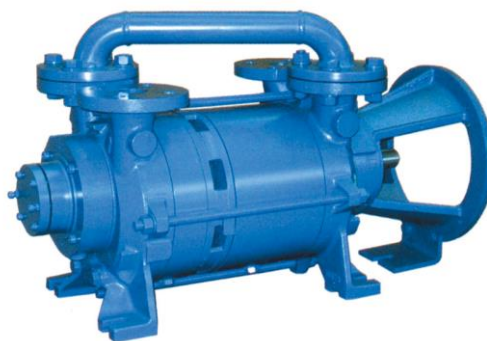
מבנה CDSL (LANTERN)

קיים בדגמים 3,4,5 CDS בלבד והוא מאפשר חיבור מנוע ללא בסיס משותף עם המשאבה.